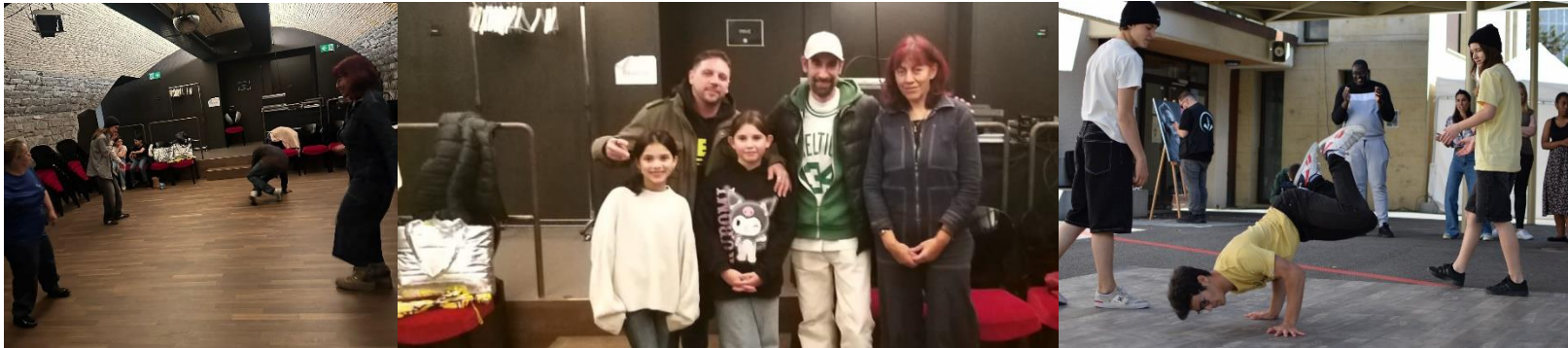
Vue d'ensemble en chiffre pour 2023